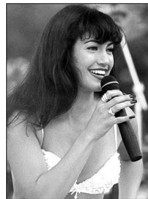
Lopez in movie Selena